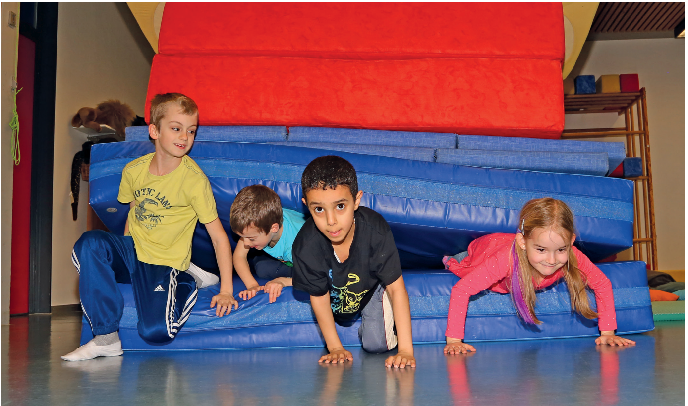
Erfolgreich befreit – für Kommendes gestärkt!