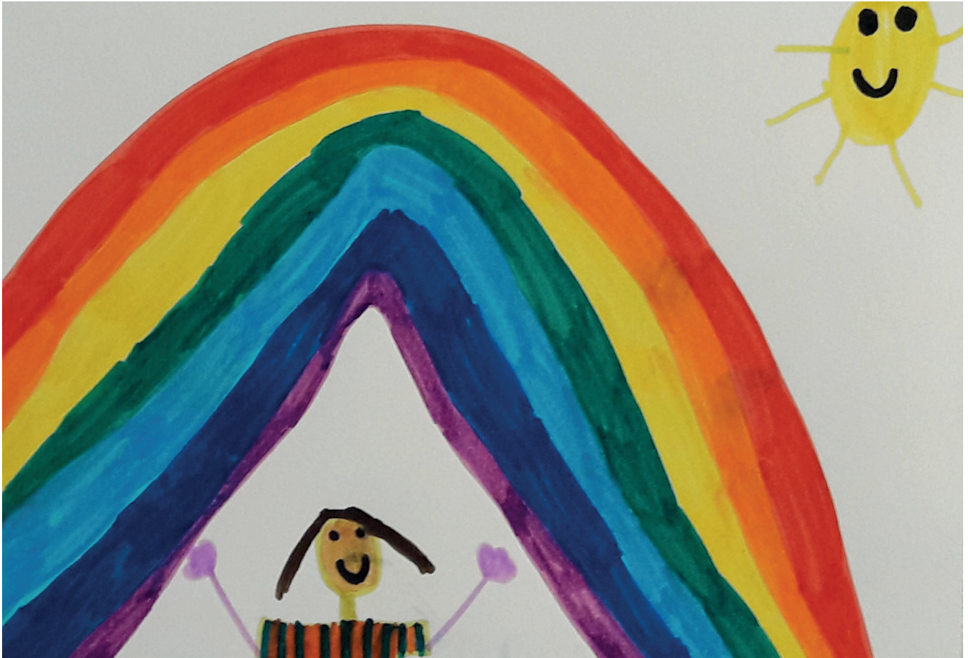
Juchhu – ich kann es!