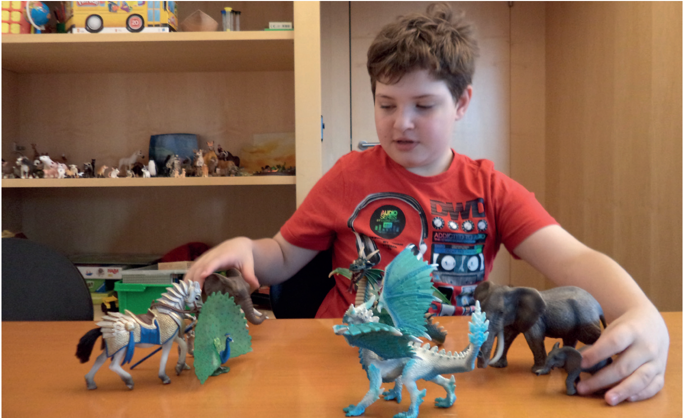
Abklärungssituation im SPD