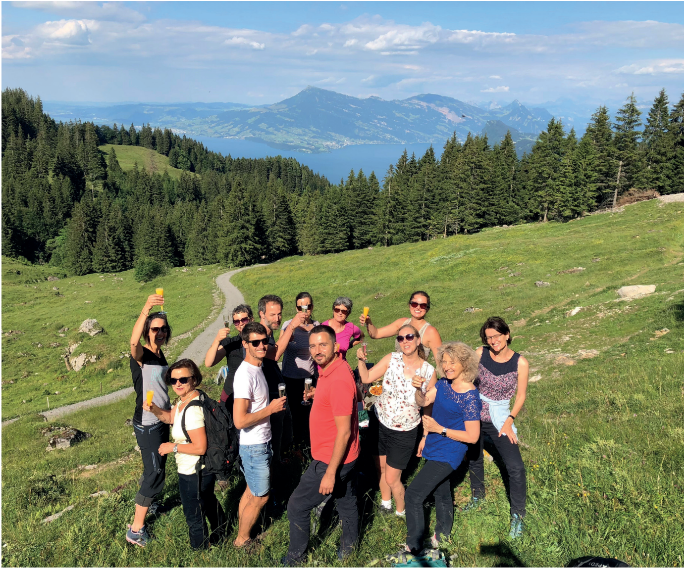
Gemeinsam unterwegs – Teamausflug Schuldienste zur Alpgschwänd